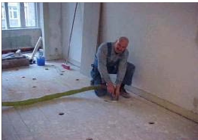
inblazen in de praktijk

Het isoleren met Easycell is gemakkelijk uit te voeren. Gewoon een gat boren – inblazen – gat dicht – klaar!