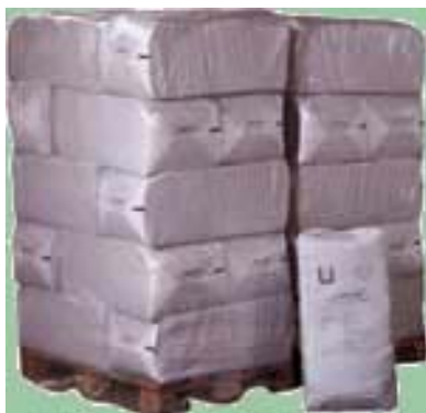
Easycell op pallets

Hier valt op eenvoudige wijze iets aan te doen met Easycell, en dat zonder ingrijpende en dure verbouwing. Door jarenlange toepassing van dit product in verschillende landen heeft het product zijn kwaliteiten ruimschoots bewezen. Vele testen door onafhankelijke instanties hebben de uitstekende eigenschappen aangetoond en in certificaten vastgelegd.