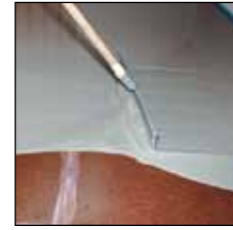
Egalisatie / uitvlakken