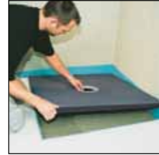
Douche-elementen PCI Pecibord

PCI staat voor tegelijmsystemen en bouwchemische producten voor bouwprofessionals, dus professionele gebruikers.