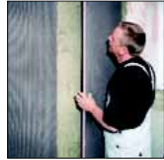
XPS-hardschuimplaten PCI Pecidur